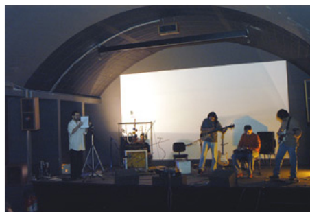
Olho Caligari: performance contemporânea