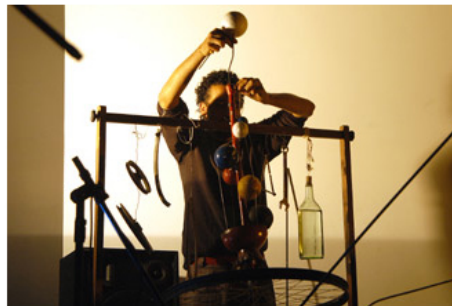
Scarassatti busca novo som em performance da Caligari

* Comente esta notícia * Índice do Portal Unicamp * RSS